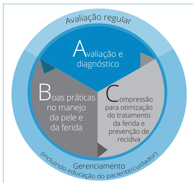
Figura 1. Modelo ABC.

O Modelo ABC compreende as etapas “avaliação”, “boas práticas na gestão da ferida/pele” e “compressão”, que podem ser sintetizadas com a apresentação de quatro, cinco e sete recomendações, respectivamente (Figura 2). A adoção do