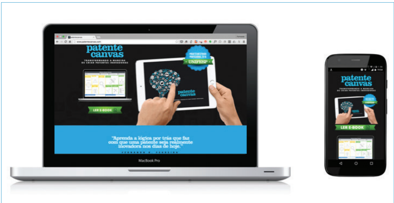
Figura 3. Patente Canvas | Versão PC e Mobile.