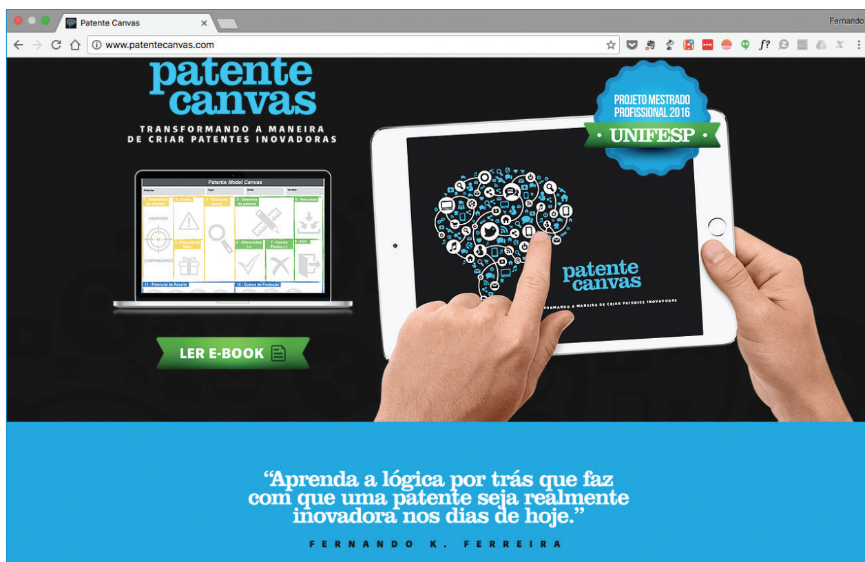
Figura 1. Site: patentecanvas.com.

O Patente Canvas pode ser acessado por meio de um e-book disponível no site: < http://www.patentecanvas.com >.